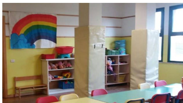
Sezioni arancione e gialla