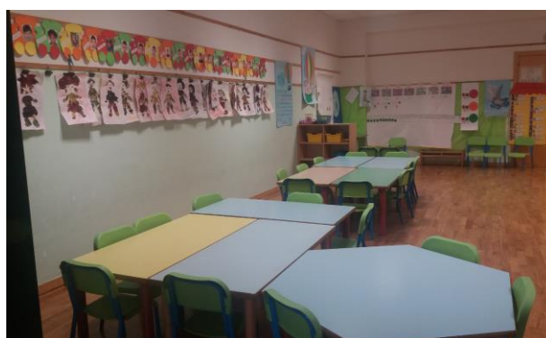
Sezioni azzurra e verde